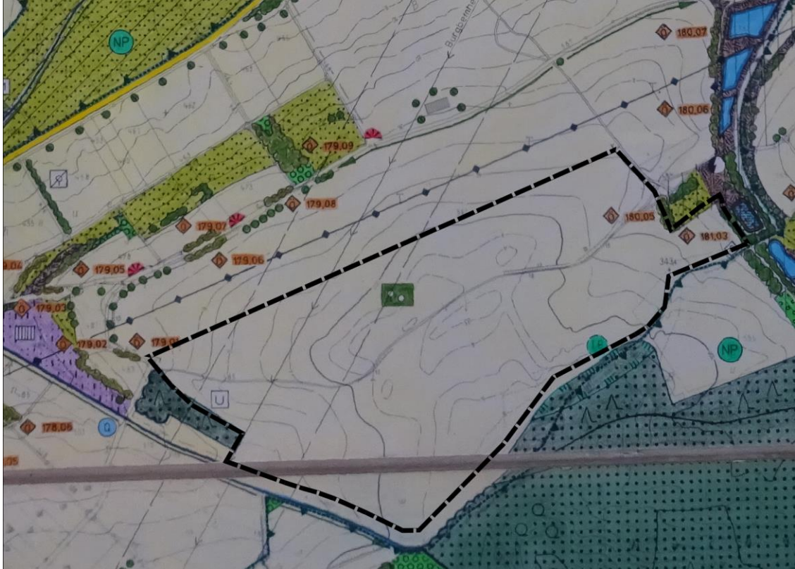
Ausschnitt aus dem wirksamen Flächennutzungsplanes mit Abgrenzung des Änderungsbereiches (nicht maßstäblich)

Der Markt Sugenheim verfügt über einen Flächennutzungsplan mit Landschaftsplan. Dieser stellt für das Plangebiet Flächen für die Landwirtschaft mit dem Hinweis der Flurdurchgrünung dar.