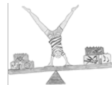
Grundschule Ehegrund Sugenheim

Alle wichtigen Inhalte finden Sie auf unserer Homepage unter www.ehegrundschule-sugenheim.de .