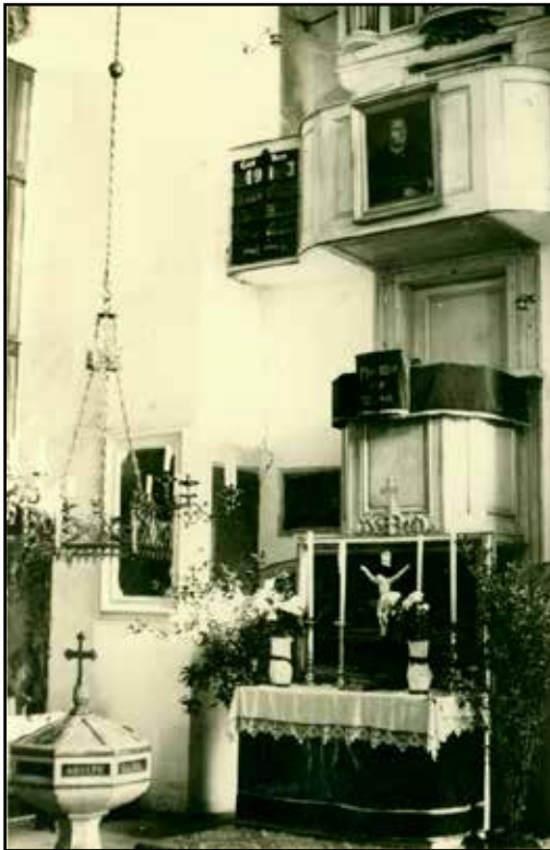
Altarraum der Sugenheimer St. Erhards- Kirche in den 1950er Jahren auf einer Ansichtskarte