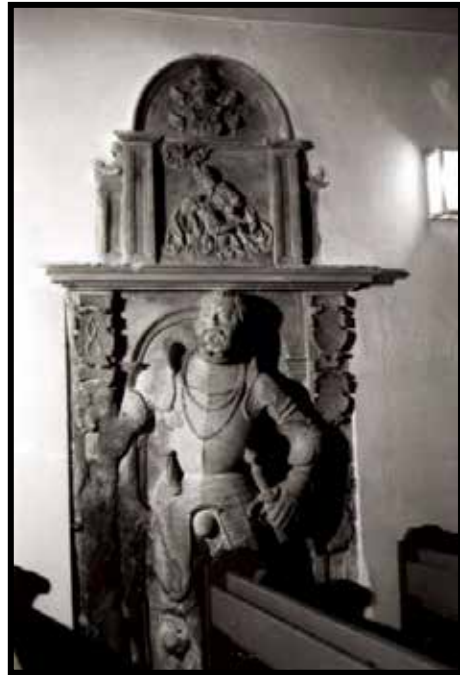
Epitaph Nr. 2, Langhaus Südseite (Saniert)