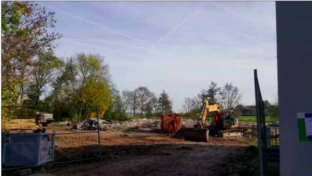
Der Abriss im Jahr 2022 ist vollendet.

Plan des Landschaftsarchitekten Frieder Müller-Maatsch vom gleichnamigen Planungsbüro für das Freizeitareal „Altes Sägewerk“ auf dem Gelände der ehemaligen Unteren Mühle in Sugenheim.